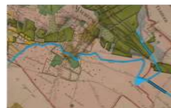
Cheminement des rigoles royales Mise en évidence sur le plan d'intendance de Maurepas