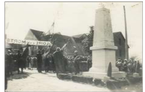
Inauguration du monument commémoratif

Inauguré en 1920, ce pilier commémoratif, est formé d'un obélisque sur socle cerné d'un entourage avec obus, à la mémoire des enfants de MAUREPAS morts pour la patrie lors des guerres de 1914-1918, 1939-1945, Algérie 1957-1962.