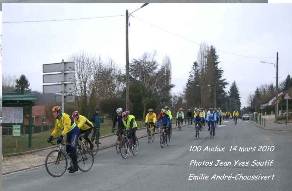
100 Audax 14 mars 2010