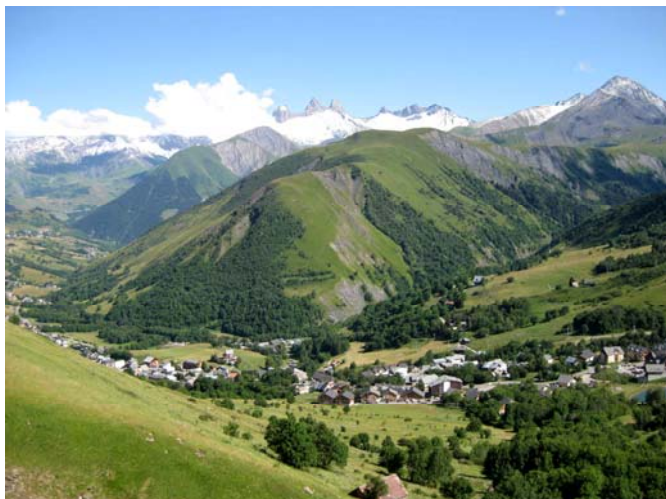
Saint Sorlain d'Arves et les aiguilles d'Arves

Là-haut, à 2645 mètres, un splendide panorama sur le massif des Ecrins nous attend. Nous savourons l'instant avant de nous couvrir pour attaquer la descente vertigineuse sur Valloire. Ensuite, la montée pour rejoindre le Télégraphe dans ce sens est une formalité. La matinée s'achève par une nouvelle descente sur Saint-Michel de Maurienne où nous déjeunons.