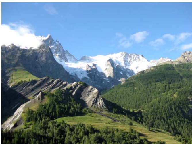
Le glacier de la Meije

Après une nuit dans le lycée de Vizille, nous prenons le départ à 5 heures dans un peloton d'une centaine de cyclos sous escorte moto. Nous débutons par 30 kilomètres de faux-plat montant à allure soutenue. Ce n'est qu'après Bourg d'Oisans que la route s'élève vraiment. L'Alpe d'Huez est à notre gauche mais elle n'est pas au programme, ce sera pour une autre fois. Nous prenons la direction du barrage de Chambon, premier point de contrôle. Il fait un temps magnifique. Cette première montée est relativement douce et régulière. Nous arrivons au barrage, premier point de contrôle, sans avoir consenti de réels efforts.