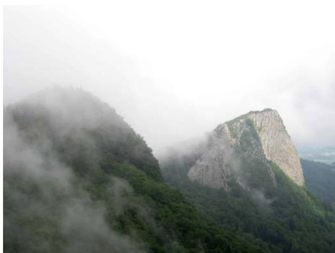
La roche Tuilière dans la brume