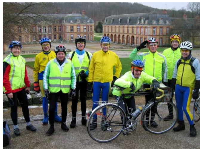
Bulletin N° 114 - 2 ème trimestre 2010

La maniabilité a pour objectif de permettre à chacun des stagiaires de bien maîtriser son équilibre et son vélo, notamment sous l'aspect freinage, utilisation des développements, mais aussi d'être en mesure de faire face à des obstacles inattendus.