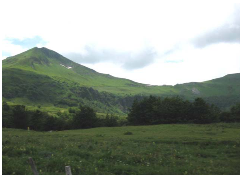
Le Puy Mary et le Pas de Peyrol