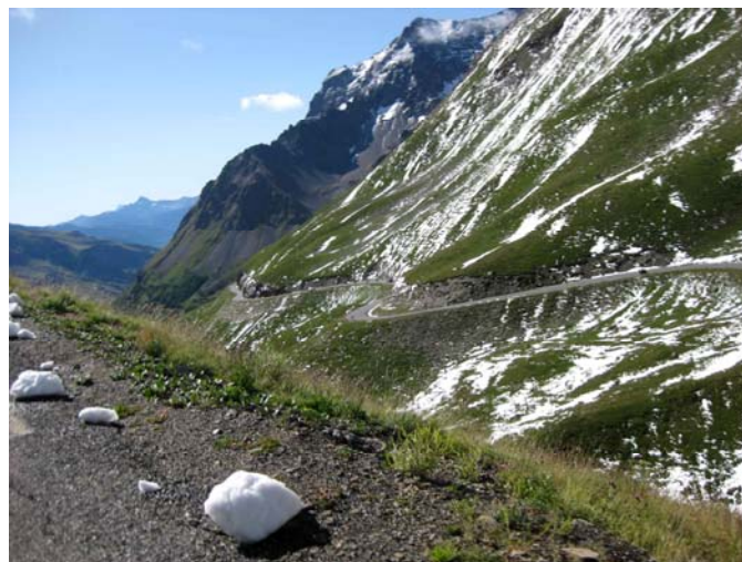
La neige dans les pentes du Galibier

C'est maintenant que les choses sérieuses commencent. La route est étroite, sinueuse, en mauvais état. Mais le décor est exceptionnel. Nous montons les pentes du Lautaret en admirant le massif de la Meije à notre droite. Les pourcentages de ce col ne sont pas très élevés : une véritable rampe de lancement pour le clou de la journée : le Galibier.