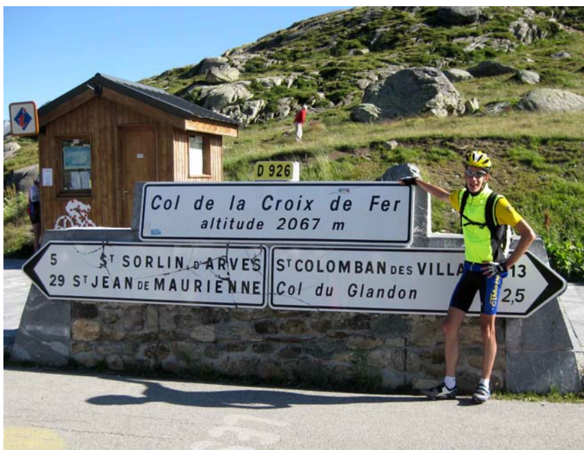
Inoubliable col de la Croix de Fer